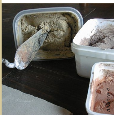
Des essais préalables sont pratiqués afin de rechercher la teinte et surtout de faire connaissance avec la technique.