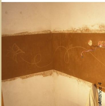
Le tadelakt peut s'utiliser pour créer une crédence de cuisine, de salle-de-bains ou simplement pour son aspect décoratif très riche.