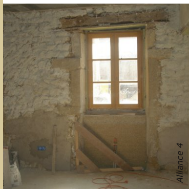
Préparation de cet ancien mur en pierre : gobetis avant application d'un enduit chaux/chanvre + rupture thermique en béton de chanvre sous la fenêtre + enduit chaux/ponce sur le soubassement agissant comme tampon hygrométrique.