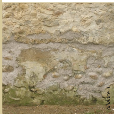
Reprise du mur avec des galets et un mortier de chaux NHL2/sable. La consolidation du support est une phase importante de la préparation.