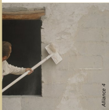
Gratter les enduits anciens dont la tenue est mauvaise. Sur le bâti ancien, retirer si possible les revêtements à base de ciment ou de résine.