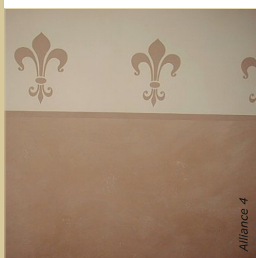
Décor réalisé au pochoir, sous-bassement appliqué au spalter par un mouvement en X.

L'aspect de la peinture à la caséine s'approche d'un badigeon à la chaux : mat, velouté et résistant.