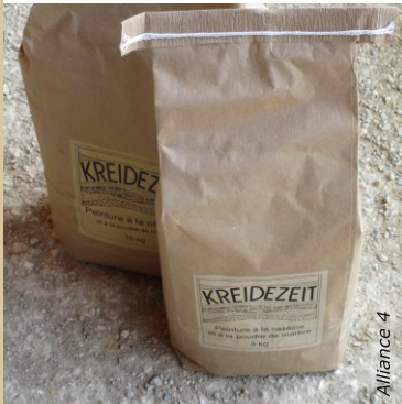
La peinture à la caséine existe également en produit prêt à l'emploi sous forme de poudre à mélanger à de l'eau.