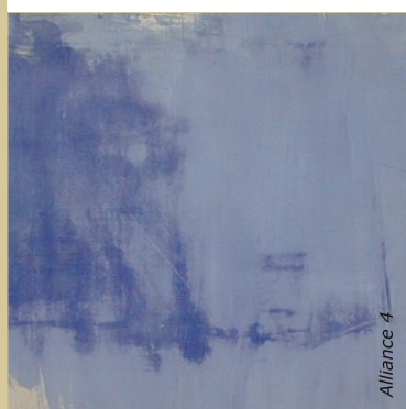
La peinture à la caséine s'éclaircit d'environ 50 % au séchage. Faire des recherches de teinte au préalable sur du papier aquarelle.