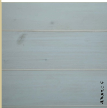
La lasure s'applique notamment sur un lambris neuf.

Ce dosage donne environ 2 litres de peinture et permet de couvrir environ 30 m 2 .