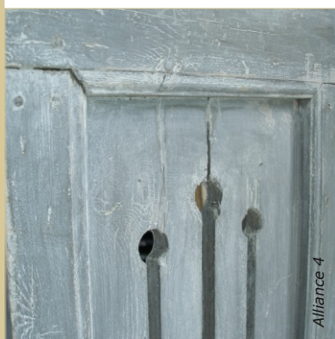
Lasure sur volet ancien : La peinture ancienne est brossée, le bois mis à nu absorbe la lasure et les zones peintes sont juste éclaircies.

Nettoyer sans attendre les outils à l'eau après utilisation.