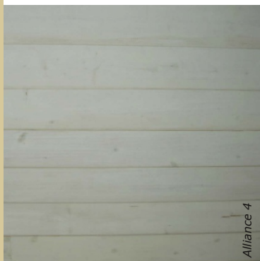
Blanche ou colorée, la lasure teinte le bois tout en laissant apparaître ses veines.

Cette lasure est une peinture décorative pour bois neufs ou anciens, en intérieur. Plus ou moins transparente selon la quantité de chaux entrant dans sa formulation, elle laisse apparaître les veines du bois. Souvent blanche, il est possible de la teinter en ajoutant des pigments.