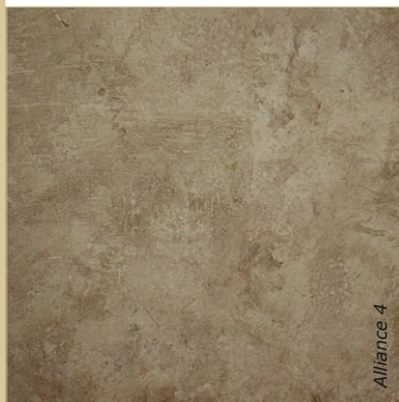
Glacis appliqué à l'éponge sur enduit à la chaux brut, teinté au pigment ombre naturelle.