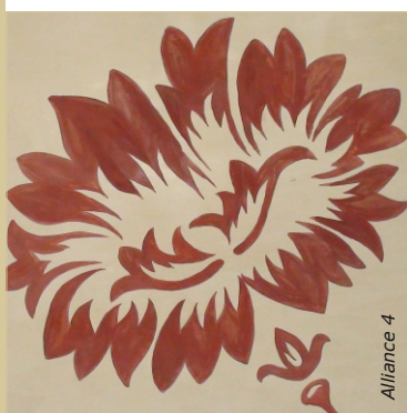
Décor en glacis oxyde rouge peint à main levée sur un badigeon à la chaux.

Sur un support très poreux tel qu'un enduit à la chaux, un plâtre ou un badigeon, le glacis sera tout de suite absorbé. Préparer dans ce cas un glacis très dilué et peu chargé en pigment. Passer plusieurs couches fines jusqu'à obtention du résultat escompté.