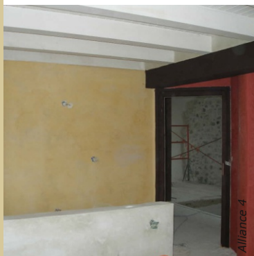
Des enduits à la chaux neutres sont mis en teinte par des glacis jaune et rouge.