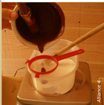
Pour teinter une peinture, diluer au préalable les pigments. Intégrer cette pâte colorante à la peinture.