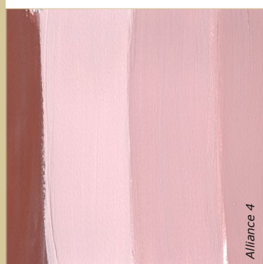
La recherche de teinte d'une peinture est appliquée sur du papier, ici le pigment "prune" en plusieurs dilutions dans la chaux et en glacis à la caséine (à gauche).

Voir fiche : Mise en œuvre -> Formulation -> Préparation du liant à la caséine