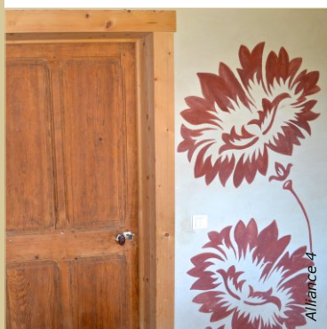
Le poncif a été utilisé pour réaliser plusieurs motifs. Ils sont ensuite peints à main levée avec un glacis à la caséine. La peinture de fond est un badigeon à la chaux teinté à l'ocre jaune.