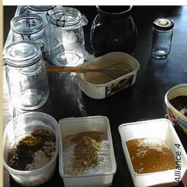
Recherche de teinte pour la coloration d'un badigeon. Il est possible de mélanger plusieurs pigments entre eux.