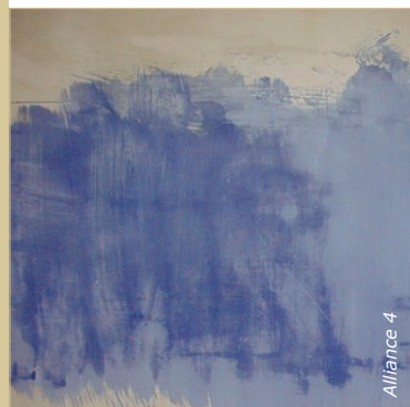
Les peintures et enduits s'éclaircissent d'environ 50 % de leur teinte en séchant.