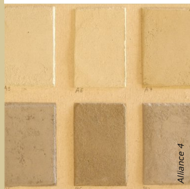
En plus des pigments, les sables utilisés dans la préparation des enduits influencent aussi la teinte. Ici ce sont les poudres de marbre noir et vertes qui teintent les enduits de finition.

Si l'enduit à la chaux est déjà sec, procéder comme décrit plus bas, en utilisant de la caséine.