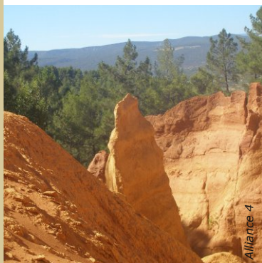
Carrière d'ocres à Roussillon (84)

Les revêtements muraux constituent des éléments essentiels de la décoration.