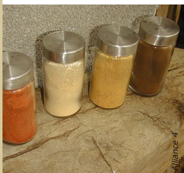
Les terres colorantes offrent une large palette de teintes naturelles et chaudes.

En revanche, les oxydes synthétiques permettent d'obtenir des teintes indisponibles dans la nature tel que les bleus et les verts soutenus. Ils ont aussi un pouvoir colorant plus fort.