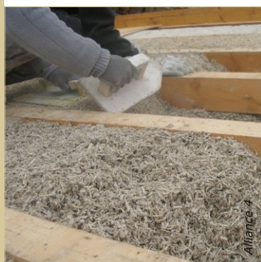
Tassage du béton de chanvre en toiture, entre chevrons avec une taloche à frapper.