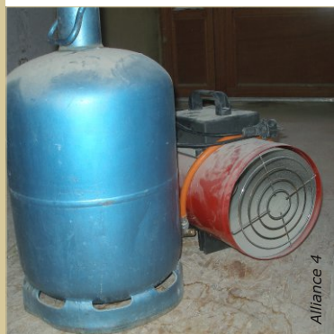
Pour favoriser l'apport de CO2 nécessaire à la carbonatation de la chaux, un chauffage soufflant à gaz peut être mis en place.