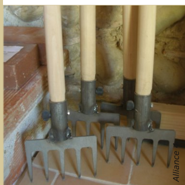
Les râteliers à bancher permettent de structurer et de tasser en profondeur les bétons de chanvre banchés.