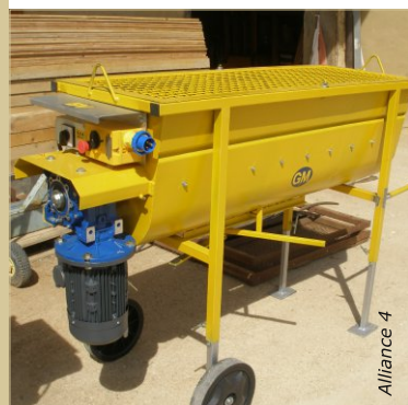
Les malaxeurs horizontaux permettent de préparer une matière parfaitement homogène.