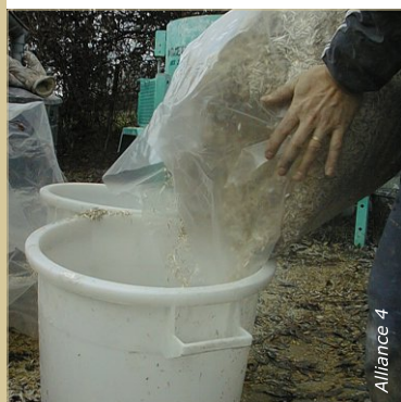
Le dosage se fait en litre dans divers contenants. Les volumes sont étalonnés en début de chantier.