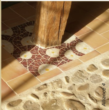
Sol en terre cuite orné d'une mosaïque et juxtaposé d'une calade en galet. Les revêtements sont réalisés en chaux aérienne pour rester en continuité du matériau chanvre.