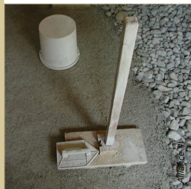
Dalle de chanvre sur hérisson ventilé. Une dame artisanale permet de tasser la dalle.