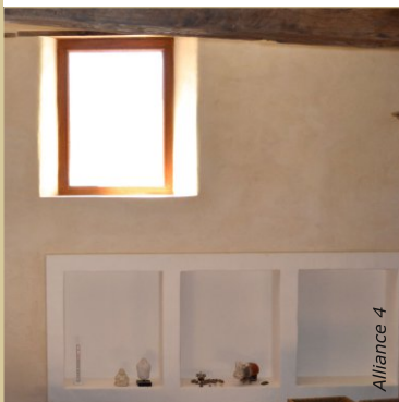
Les enduits à la chaux offrent d'innombrables possibilités de finitions, des plus rustiques au plus lisses.

Note : Les bétons de chanvre bruts créent des ambiances feutrées aux qualités acoustiques intéressantes. Toutefois, les surfaces gagnent à être enduites ou revêtues pour l'isolation phonique et l'étanchéité à l'air. Malheureusement, les enduits réduisent les propriétés acoustiques, surtout s'ils sont très lissés.