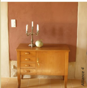
Colorés avec des pigments, les enduits à l'argile offrent des teintes sourdes et mat.