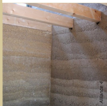
Doublement en béton de chanvre contre un mur existant.