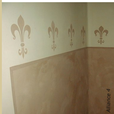
Avec le badigeon, la créativité n'a pas de limite : frises, pochoirs, décors ...