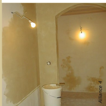
La teinte du badigeon s'éclaircit d'environ 50 % au séchage.

Nettoyer les outils à l'eau puis au savon noir. Le badigeon se conserve une à deux semaines au frais, dans un seau avec couvercle. Bien brasser avant réutilisation et ajouter de l'eau si nécessaire.