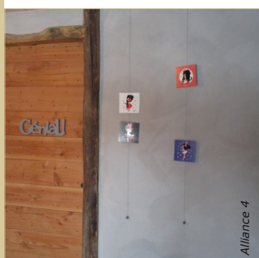
Le badigeon est naturellement nuagé. Ici il a été appliqué sur une cloison en lattis recouverte d'un enduit à l'argile, en 3 couches.

VOUS TROUVEREZ CHEZ ALLIANCE 4 TOUS LES PRODUITS POUR LA RÉALISATION DE VOTRE BADIGEON AINSI QUE POUR LES ENDUITS À L'ARGILE ET A LA CHAUX.