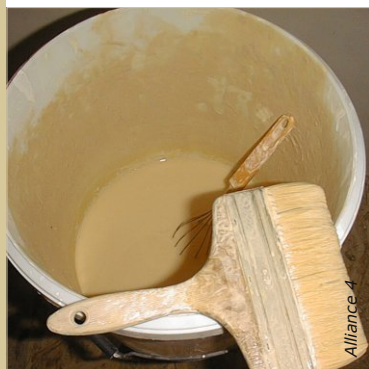
La consistance est très fluide et à tendance à se sédimer. Brasser souvent au cours de l'application.

Le badigeon à la chaux est la peinture la plus répandue dans le monde et sans aucun doute la plus économique.