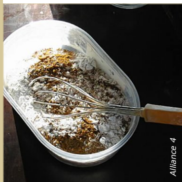
Mélanger les ingrédients secs. Noter précisément le dosage en pigments afin de pouvoir le reproduire.