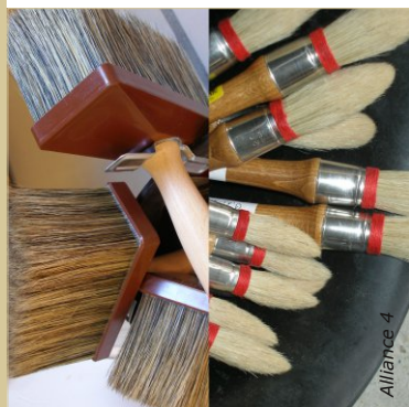
Les outils : brosse à badigeon rectangulaire avec des soies souple et une brosse à réchampir pour peindre les bordures.