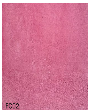
FC02 Mortier fin à la chaux prêt à l'emploi + 10 % rouge porto