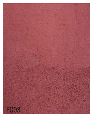
FC03 Mortier fin à la chaux prêt à l'emploi + 10 % rouge rouge