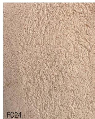
FC24 1 vol chaux aérienne en poudre + 3 vol poudre de marbre rose