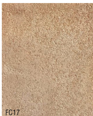
FC17 1 vol chaux aérienne en poudre + 1,5 vol poudre de marbre rose + 1,5 vol sable blanc N°1, 0-1