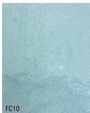
FC10 Mortier fin à la chaux prêt à l'emploi + 10 % vert M.C.