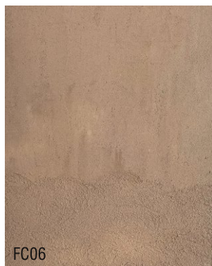
FC06 Mortier fin à la chaux prêt à l'emploi + 10 % ombre calcinée