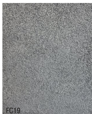
FC19 1 vol chaux aérienne en poudre + 1,5 vol poudre de marbre noire + 1,5 vol sable blanc N°1, 0-1