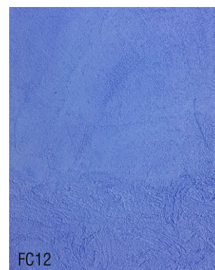
FC12 Mortier fin à la chaux prêt à l'emploi + 10 % bleu outremer