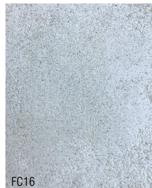
FC16 1 vol chaux aérienne en poudre + 1,5 vol poudre de marbre verte + 1,5 vol sable blanc N°1, 0-1