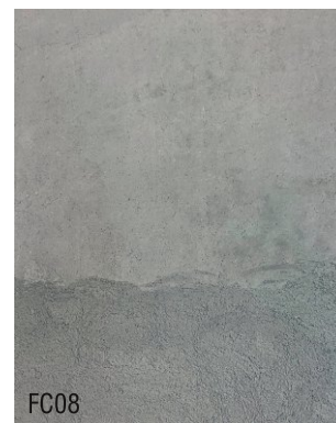
FC08 Mortier fin à la chaux prêt à l'emploi + 10 % noir indien