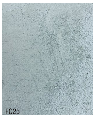
FC25 1 vol chaux aérienne en poudre + 3 vol poudre de marbre verte