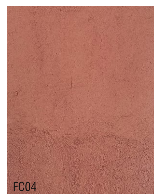
FC04 Mortier fin à la chaux prêt à l'emploi + 10 % rouge indien