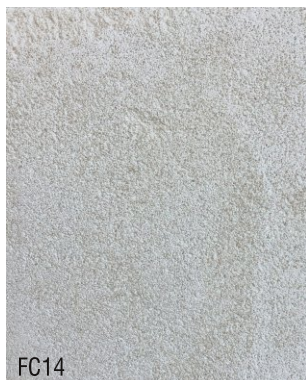
FC14 1 vol chaux aérienne en poudre + 1,5 vol poudre de marbre blanche + 1,5 vol sable blanc N°1, 0-1