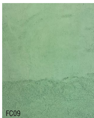
FC09 Mortier fin à la chaux prêt à l'emploi + 10 % vert pistache