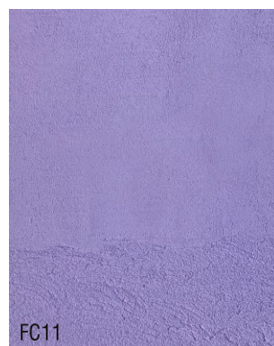
FC11 Mortier fin à la chaux prêt à l'emploi + 10 % violet outremer