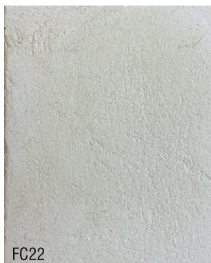
FC22 1 vol chaux aérienne en poudre + 3 vol poudre de marbre blanche