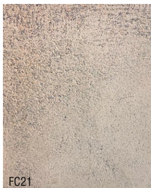
FC21 1 vol chaux aérienne en poudre + 1,5 vol poudre de marbre rose + 1,5 vol poudre de marbre noire