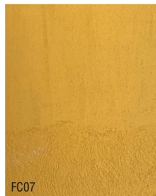
FC07 Mortier fin à la chaux prêt à l'emploi + 10 % oxyde jaune