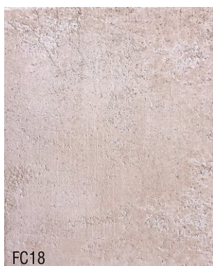
FC18 1 vol chaux aérienne en poudre + 1,5 vol brique pilée 0-1 + 1,5 vol sable blanc N°1, 0-1