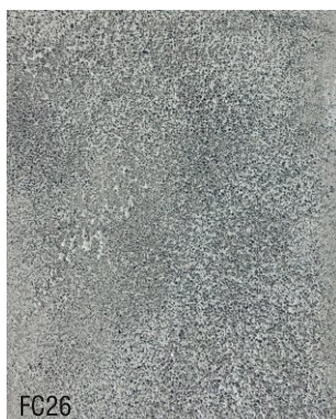
FC26 1 vol chaux aérienne en poudre + 3 vol poudre de marbre noire