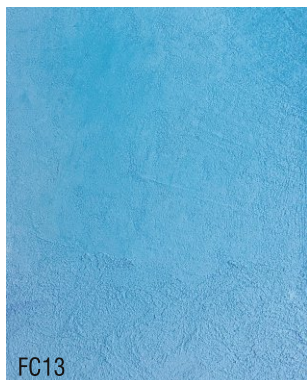
FC13 Mortier fin à la chaux prêt à l'emploi + 10 % bleu M.C.