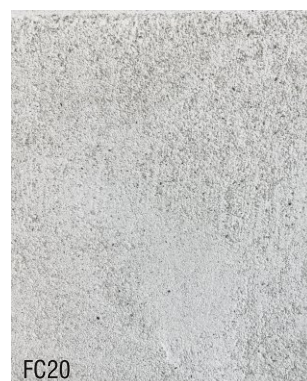
FC20 1 vol chaux aérienne en poudre + 1,5 vol poudre de marbre blanche + 1,5 vol poudre de ponce 0-1