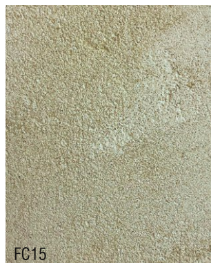
FC15 1 vol chaux aérienne en poudre + 1,5 vol poudre de marbre jaune + 1,5 vol sable blanc N°1, 0-1