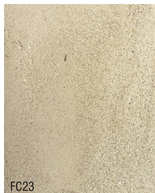
FC23 1 vol chaux aérienne en poudre + 3 vol poudre de marbre jaune